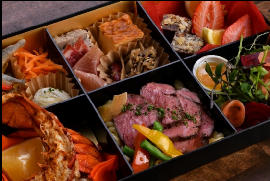
お客様の声によりリッチバージョン登場!

《C》ル・パン ¥5,000/1人前 オードブル8品+オマール海老のソテー 国産牛サーロインのローストビーフ